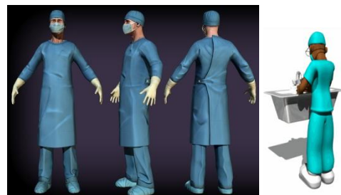
Fig.1 : Génération d'un clinicien virtuel